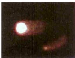
図3：VIBE なし(抗発癌作用無し)で発癌影響(紫外線)下に露出された遺伝子細胞、プラス比較のコメットの「尾」の映像-崩壊した遺伝子細胞が電極に向かって流れ出している。