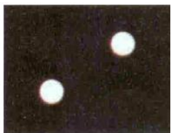
図2：遺伝子細胞への発癌影響(紫外線)なし マイナス比較の例(細胞2個)。

「画期的な、液状の複合フォトニュートリエント栄養補助飲料が遺伝子の突然変異に及ぼす影響」*